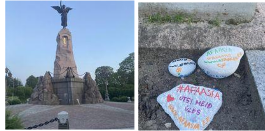
Pildil: Afaasialiidu teadlikustamise kivid Russalka juures.