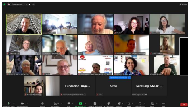
Pildil: kuvatõmmis 3.06. 2024 AIA zoomis toimunud koosolekust.