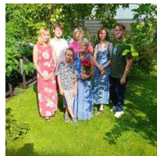
Pildil: Endised sõjapõgenikud- Pesarimaja üürilised Afaasialiidul külas.