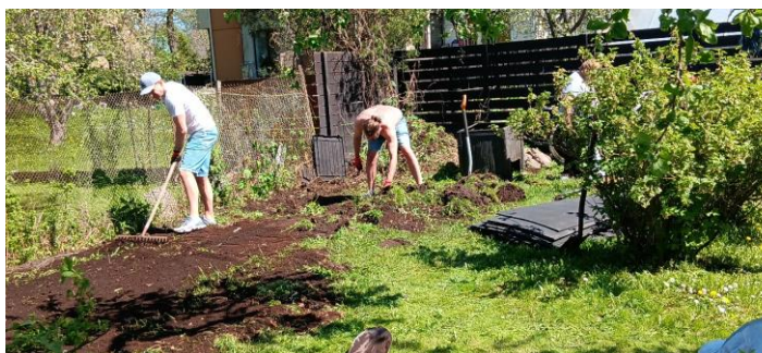
Pildil: talgud 19.mail 2024