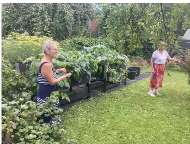
Pildil: aiaelu 1. augustil 2024