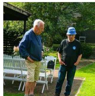
Pildil: Usinad aiaelu eest hoolitsejad